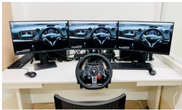
ドライビングシミュレーター

設備：ReoGo-J、@ATTENTION、ドライビングシミュレーター、G-TES 3Dプリンター、Prediction One（予後予測AI）、RK-10DM（RPA）、心肺負荷試験、免荷式歩行者、嚥下造影・内視鏡検査、InBody、嚥下障害治療機器（バイタル・ジェントルスティム）、各種装置、ワークサンプル幕張版、IVES、各種物理療法機器など