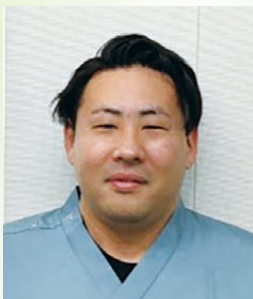
栄養科 管理栄養士