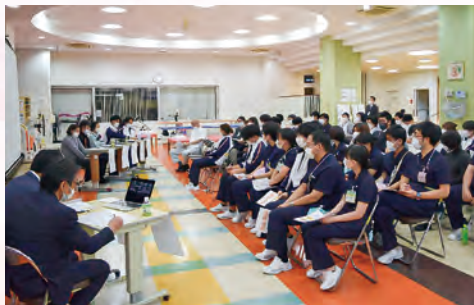
▲ 現地・ZOOMを合わせて約350名が参加しました。

令和5年11月27日に関東カマチグループ17病院の職員を対象にむすびプロジェクト研修会を開催しました。第2回目となった今回は、蒲田リハビリテーション病院を退院された患者様と退院後の支援に関わられた介護支援専門員・自立訓練事業所の理学療法士・訪問リハビリの作業療法士、地域の支援事業所スタッフ5名をお招きし、シンポジウム形式で開催しました。脳卒中を発症後に新規就労を目指している事例を通して、回復期リハビリテーション病院、地域の支援事業所との連携についての経緯や支援内容と今後の支援について、ご講義をいただきました。総勢350名程のグループ病院の職員が現地・Zoomにて集い退院後の地域の支援事業所との連携の大切さに関する知識を深めました。患者様の声を直接聞いたこともとても貴重な機会となりました。今後も患者様へのサービスの質の向上につながるよう研修会を企画していきます。