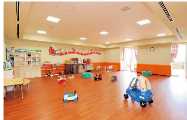
保育所 なかよし(室内)