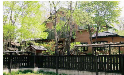
那須ロッジ(栃木県)